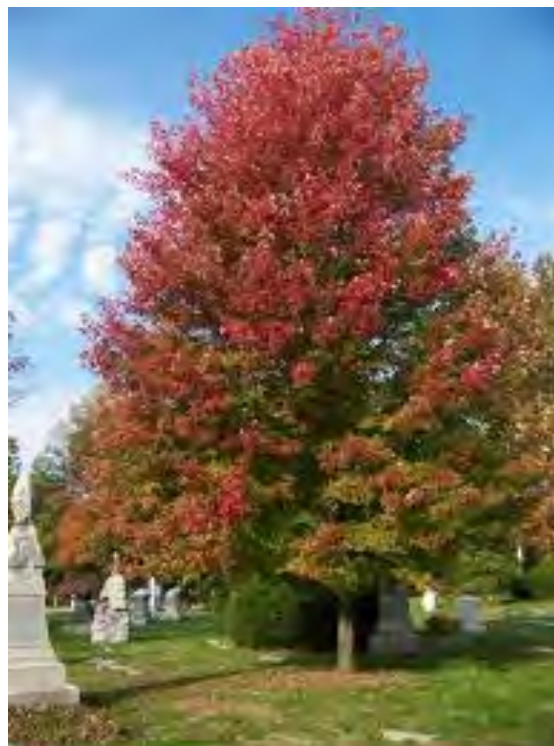
Acer freemannii 'Autumn Blaze'